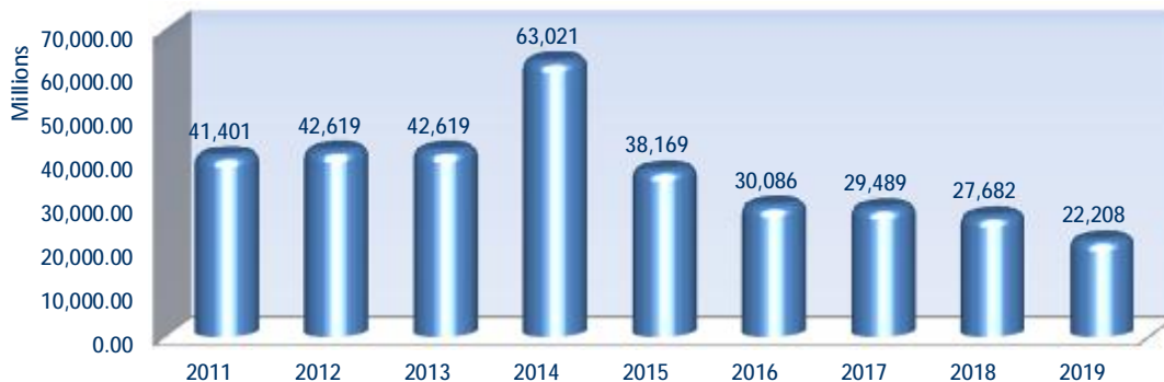
Αξία Συναλλαγών Χρεογράφων ανά έτος (σε εκατ. €)